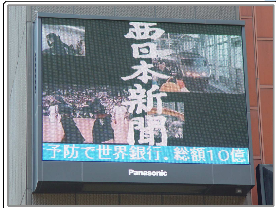
西日本ビジョン(画面サイズ/4.224m×3.072m)